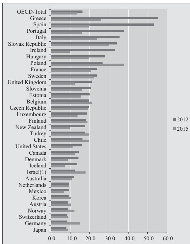
图 2：西方主要国家 2005 与 2012 青年失业率柱状对比图 (%)

对比欧盟主要国家，除德国外，其他国家的青年失业率在金融危机之后基本上都有或高或低的增长 (见图 2)。将各国 2005 年青年失业率与 2012 年青年失业率相比，可以看到失业率显著增加的国家，包括英国、法国、西班牙、希腊等，基本上都发生了青年运动或者骚乱事件，这也可以解释为何自 2007 年以来欧洲成为青年抗议运动的重灾区。