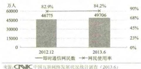
图1：2012年12月至2013年6月即时通信网民数及使用率

从近两年网络应用的变化情况看，上述4类应用情况都有明显上升的趋势，尤其是互动交流类在青年群体中应用广泛，这主要得益于手机网络的快速发展。2013年中国互联网公报显示，2012-2013年网民使用网络进行“即时通信”与“搜索引擎”分别占到84.2%与79.6%，排在前两位。其中，前者属于互动交流类，后者属于实用类。但是，其中包括将“搜索引擎”用来娱乐的，属于“休闲娱乐类”的“网络音乐”、“网络视频”与“网络游戏”分别占77.2%、65.8%和58.5%。另外，还有“博客”、“微博”分别占到68.0%、56.0%，也是属于网络应用增长较快的项目。